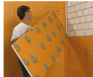
op ruwbouwwanden of gemengde ondergronden