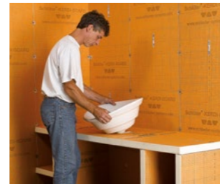
voor wastafels en vakverdelingen