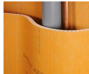
voor afgeronde en golvende wanden